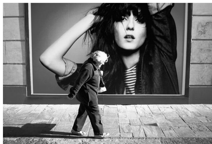
Mademoiselle oder nicht? Eine ältere Dame läuft am Plakat mit einer jüngeren Frau vorbei.